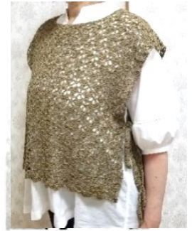
サイドオープンベスト