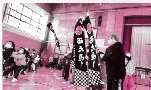
のぼり旗で応援をする応援大賞の西大通り