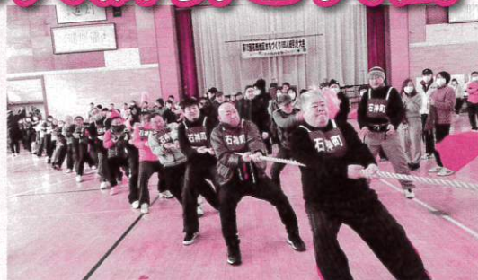
優勝した石神町Bチーム