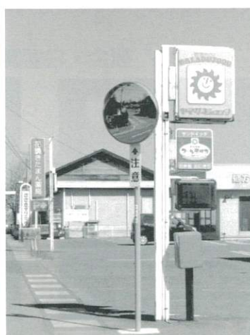
カーブミラー新設