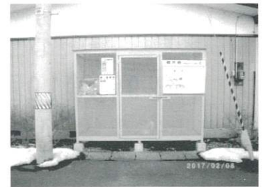
ゴミ集積施設整備