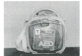
AED機器バッテリー交換